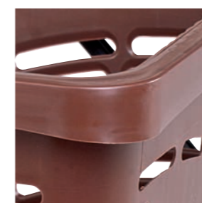
Angles accentués qui permettent de fixer le sac