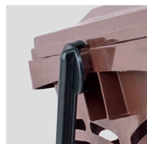
Système de fermeture sécurisée anti-animaux

Stelo est le conteneur conçu pour collecter de manière simple et pratique les restes organiques de la cuisine.