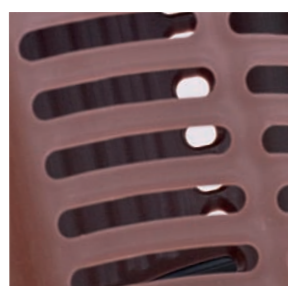
Trous pour favoriser l'aération