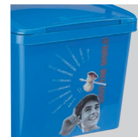
Couvercle et cuve personnalisables par photo injection (IML)