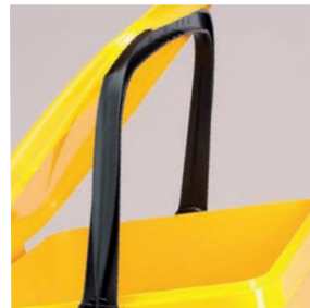
Poignée qui soutient le couvercle