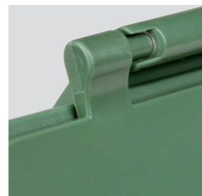
Robustes charnières rabaissées

Urba 7 est le conteneur fermé de la série Urba conçu pour la collecte des déchets organiques. Il est facile d'utilisation et peut être accroché à un mur ou sous l'évier.